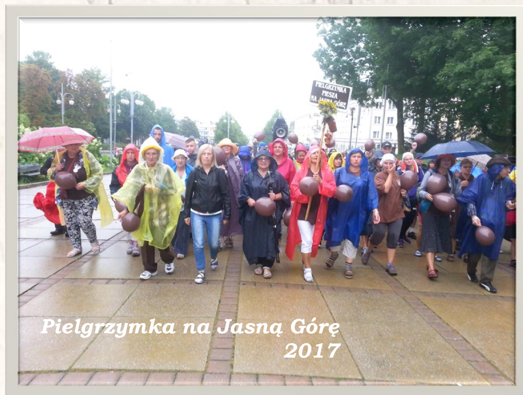
Pielgrzymka na Jasną Górę 2017

W Kręgu Biblijnym „nauczysz się rozpoznawać Oblicze Boga w słowach Boga”, to miejsce, gdzie „czytający rośnie na skutek czytania Pisma Świętego”.