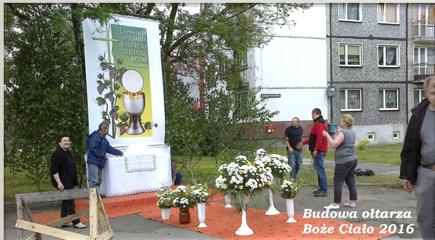
Budowa ołtarza Boże Ciało 2016

Celem spotkań Kręgu Biblijnego jest nie tylko poznanie Biblii, ale uczynienie z niej Księgi, która jest światłem dla naszego życia.