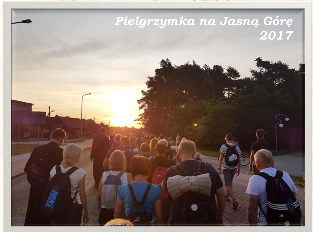
Pielgrzymka na Jasną Górę 2017

Spotkania w Kręgu Biblijnym to czas, gdzie człowiek zaczyna więcej wierzyć, zaczyna coś robić lepiej, to początek, gdzie zaczyna robić coś, co jest pragnieniem Bożym.