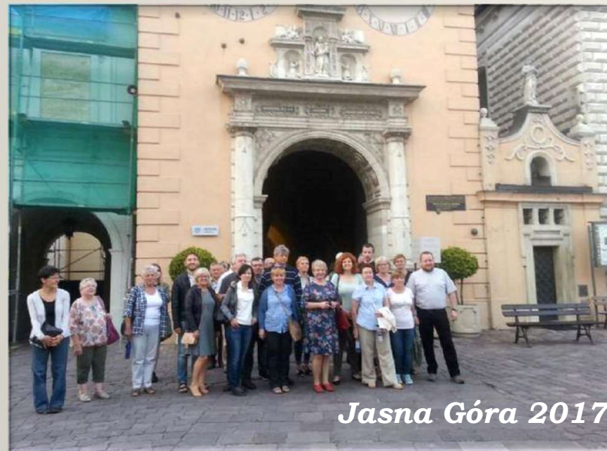
Jasna Góra 2017

Jesteśmy grupą otwartą i zapraszamy wszystkich chętnych na modlitewne czytanie Biblii umożliwiające pełniejsze i głębsze przeżycie Słowa wypowiedzianego przez Boga.