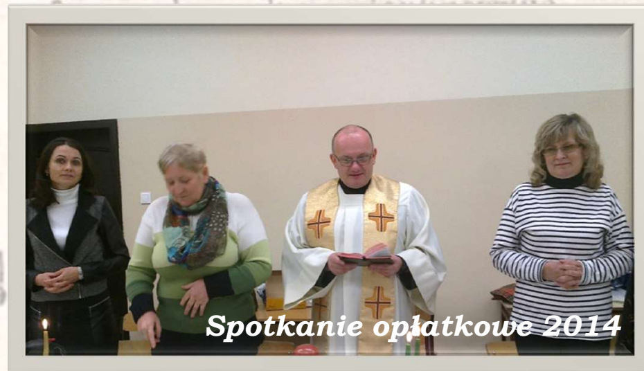
Spotkanie opłatkowe 2014

Następnie czytamy wybrany fragment Pisma Świętego, medytujemy, rozmyślamy nad tym, co Jezus chce nam powiedzieć, odnosimy go do własnego życia, po czym dzielimy się naszymi przemyśleniami, spostrzeżeniami, wątpliwościami.