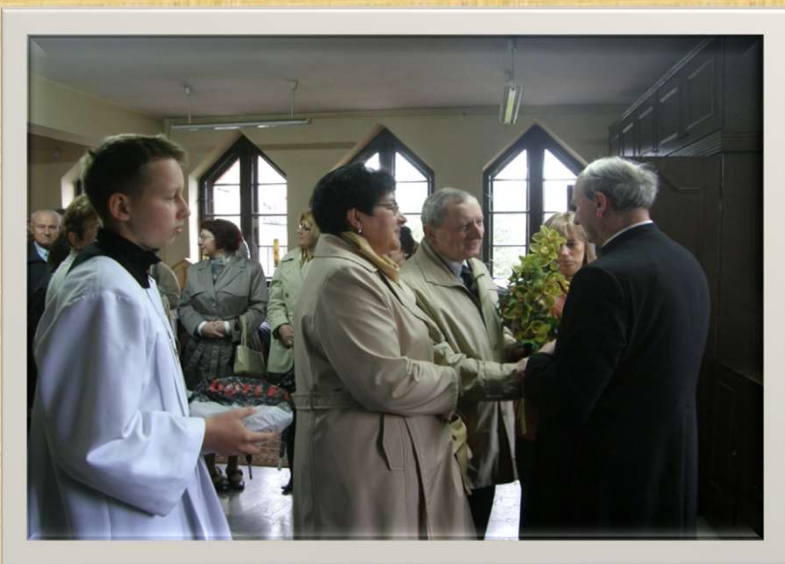
Delegacja Zespołu Caritas z życzeniami urodzinowymi dla Księdza Proboszcza